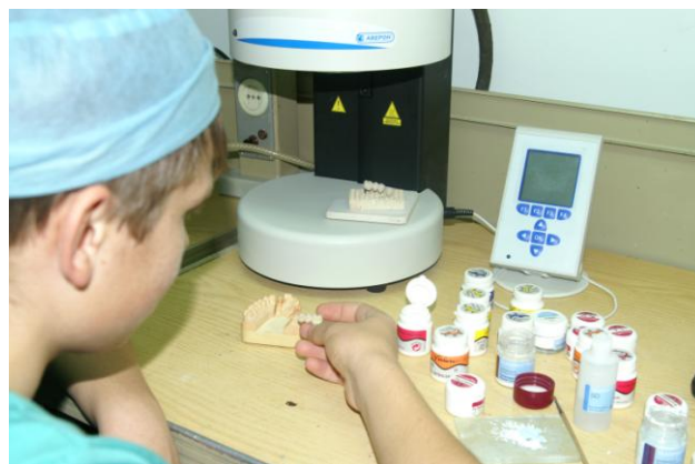
Рабочее место студента