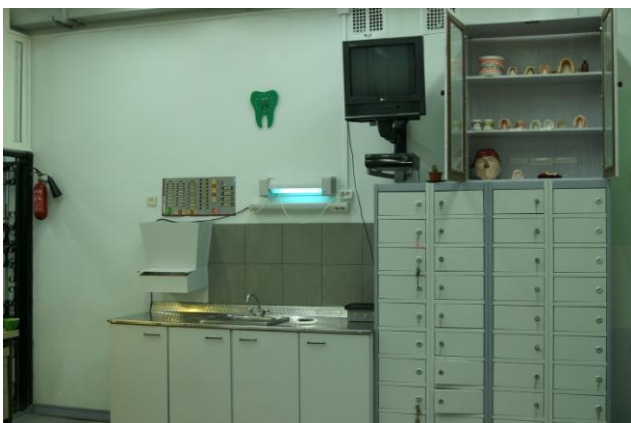
Учебная лаборатория 2006 г.