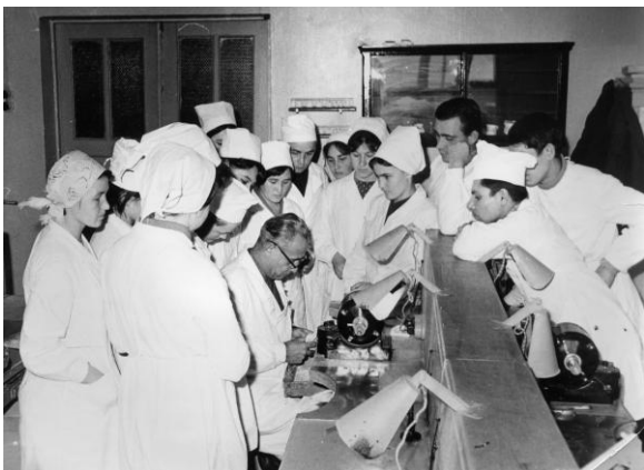
Учебная лаборатория в 1951 году.

электрополировка, пароструйная установка, электровакуумные печи.